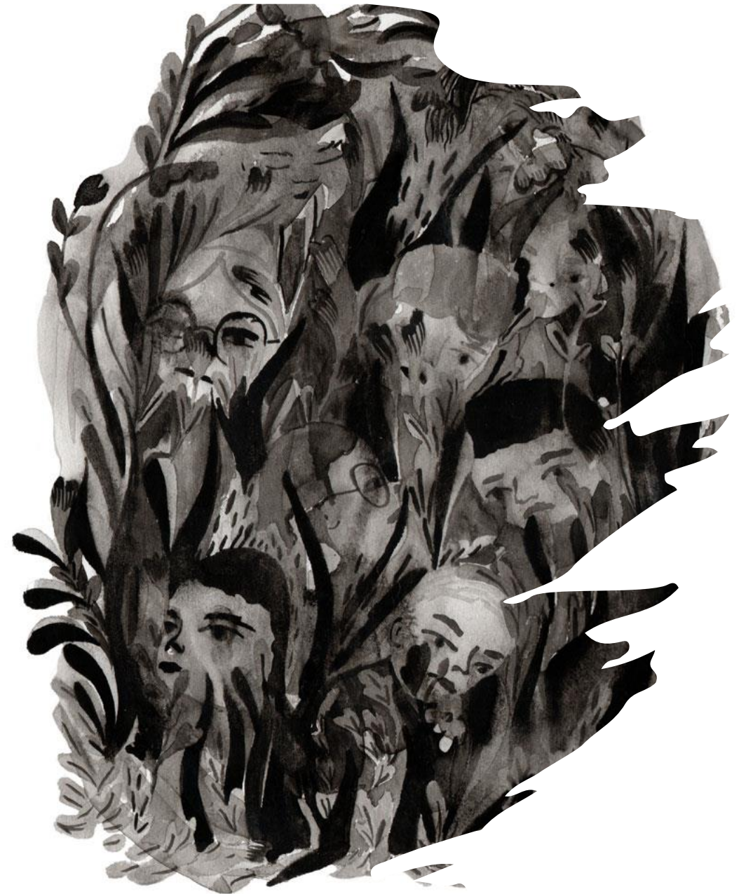
Kuvitus: Sirpa Varis