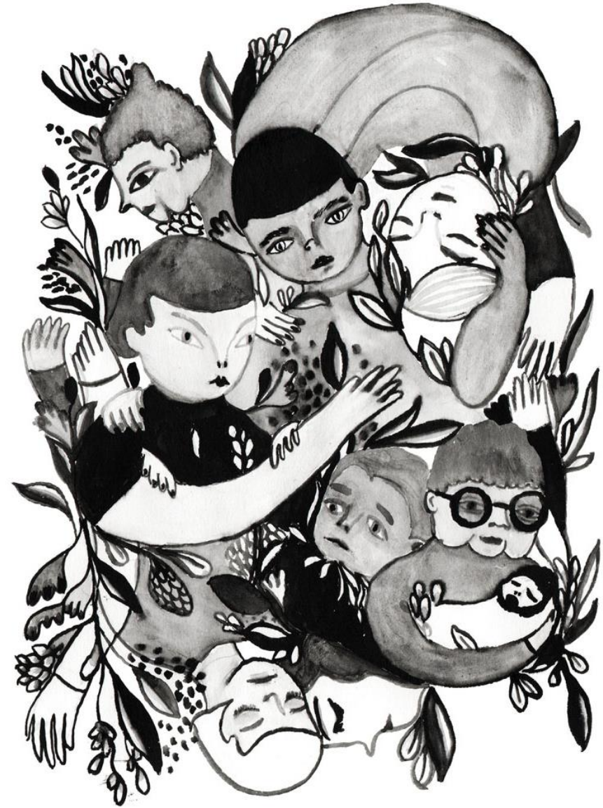
Kuvitus: Sirpa Varis