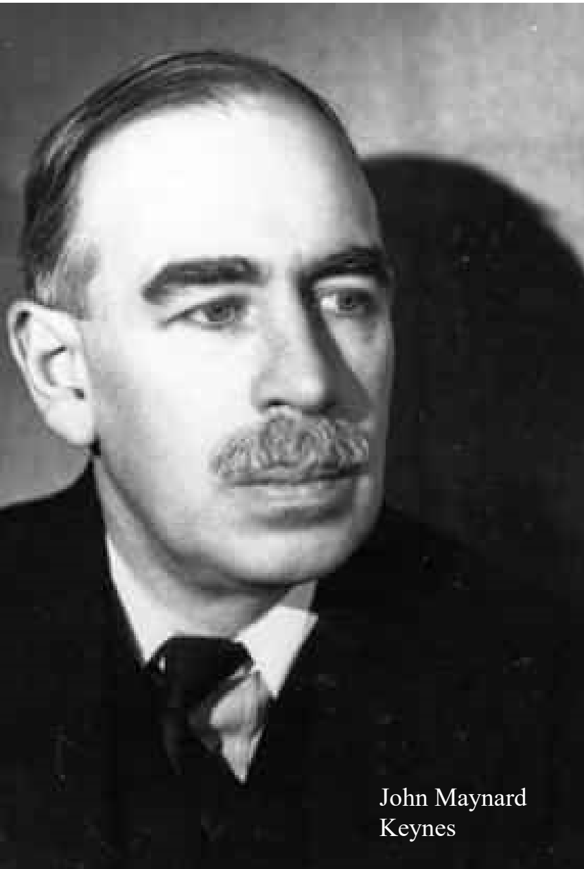
John Maynard Keynes